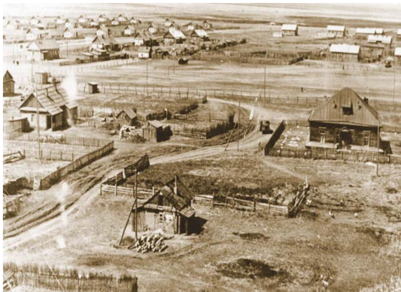
Сосновка, 1961 год. На переднем плане баня постройки 1933 года. Справа – первая больница постройки 1956 года. В центре – стадион. Слева – одиночное здание столовой, на дальнем плане микрорайон «Тамбовка», напротив него въездная арка в населённый пункт