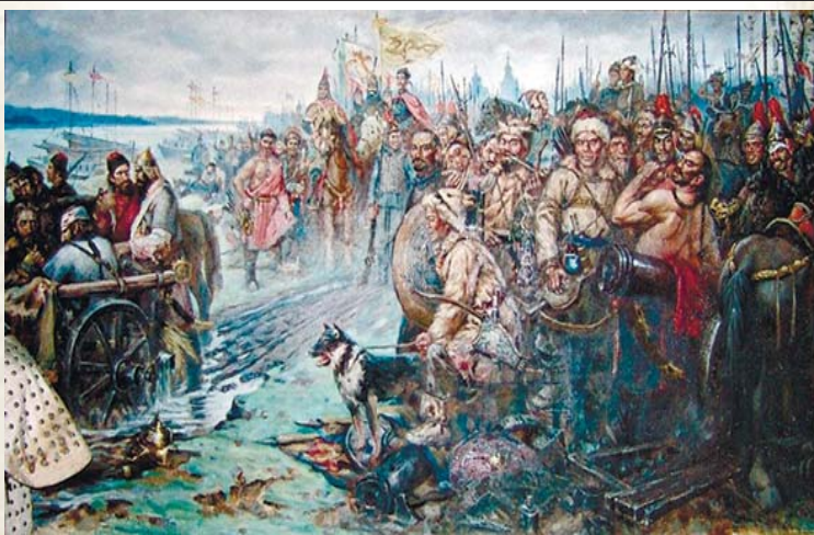
Пленение казаков-албазинцев маньчжурским войском в 1685 г.