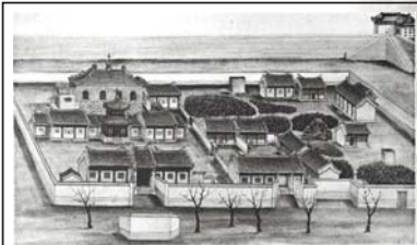
Бэйгуань (Северное подворье) в Пекине, где были поселены албазинцы

В 1685 году войска китайского императора захватили русскую крепость Албазин на Амуре. Примечательно, что пушки маньчжуров были отлиты католическими миссионерами-иезуитами, которые к тому времени уже больше ста лет действовали в Китае, и вместе с проповедью несли передовые достижения западной цивилизации [24, С. 166; 28, С. 38]. Около 50 пленных казаков-албазинцев были отправлены в Пекин, где вскоре из них сформировали отряд императорской гвардии. Их поселили на участке у северной городской стены – Бэйгуань (Северное подворье), дали в жёны вдов казнённых преступников и китайские фамилии. Православный священник