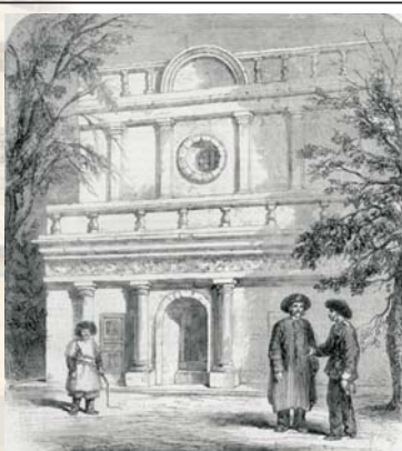
Здание Сретенской церкви, древнейшее иностранное здание Пекина, разрушено в 1991 г.

Максим Леонтьев, пленённый вместе с казаками, устроил первую церковь, для этого ему разрешили переоборудовать кумирню божества войны Гуань-ди [34, С. 20]. Эту церковь Святой Софии – Премудрости Божией, албазинцы называли также Никольской, по чтимому образу 3 Николая Чудотворца, который принёс в Китай Максим Леонтьев. Рассказы об албазинцах с караванами купцов доходили до русского императорского двора. Пётр I в 1700 году издал Указ о караванной торговле и миссионерской деятельности православного духовенства в Сибири и Цинской империи. В нём сказано, что Великий Государь, обсуждая с патриархом кандидатуру Тобольского митрополита, ставил ему задачу: