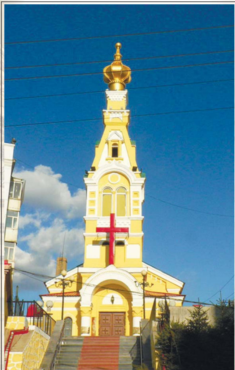
Свято-Николаевская церковь, станция «Пограничная» КВЖД (Суйфэньхэ).