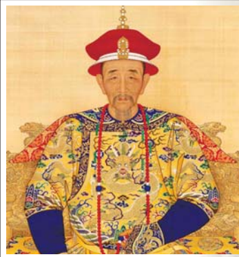
Канси (1654 - 1722), император цинской династии Китая