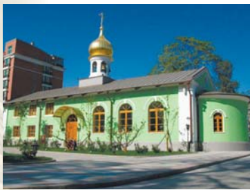
Успенская церковь на территории Миссии (ныне территория Посольства РФ в Китае). Построена в 1732 г., взамен первой православной церкви Китая – церкви Софии (Никольской), разрушенной землетрясением в 1730 г. Разрушена ихэтуанями в 1900 г., восстановлена в 1902 г. С 1957 по 2008 использовалась как посольский гараж. Восстановлена в 2009 г.